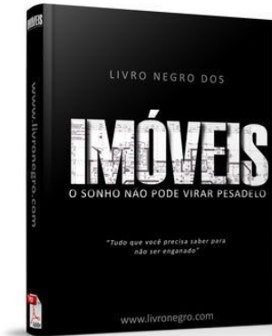
Livro Digital em PDF (e-book)

O mercado imobiliário brasileiro é repleto de golpistas, fraudadores e péssimas empresas que se aproveitam da ignorância e inexperiência daqueles que estão adquirindo seu primeiro imóvel. Escrevi o Livro Negro dos Imóveis pensando em ajudar todos que precisam comprar o primeiro imóvel com segurança. Saiba como baixar o livro agora mesmo clicando aqui.